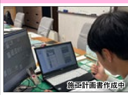
施工計画書作成中

16 佐賀208号 川副地区道路照明設備外設置工事 R7.12.26 ~ R8.9.18